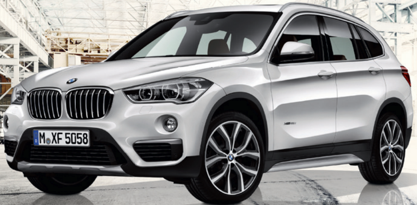
Abbildung exemplarisch, zeigt Sonderausstattung.