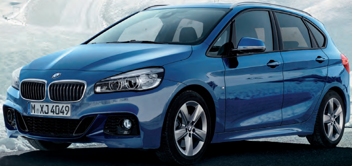
Abbildung exemplarisch, zeigt Sonderausstattung.