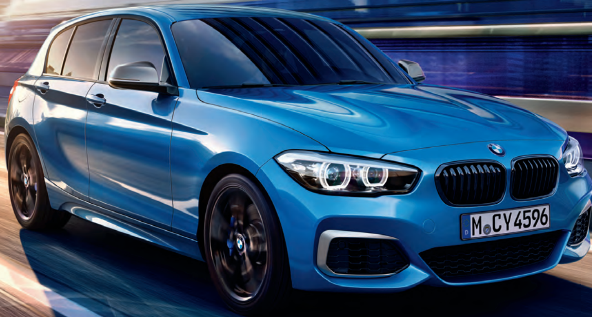
Abbildung exemplarisch, zeigt Sonderausstattung.