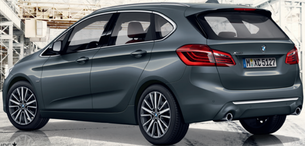
Abbildung exemplarisch, zeigt Sonderausstattung.

UNSERE JUBILÄUMS-MODELLE: ENTFALL DER ANZAHLUNG BEI INANSPRUCHNAHME DER UMWELTPRÄMIE 5 .